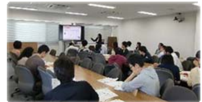
【説明会 参加者人数と所属】